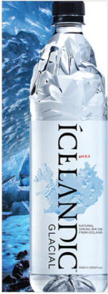
( https://tools.freshnews.asia/banner/iqyvej2nh.gif/click )